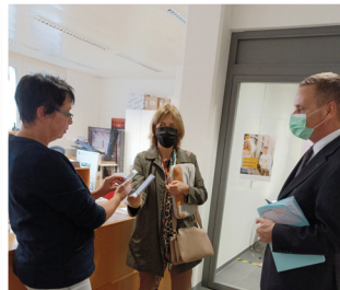
Besuch Regierungsrat Gallati

Trotz Corona konnten wir unsere 100-Jahre Jubiläumsfeier im September wie geplant durchführen - was für uns alle eine grosse Freude war. Hoffnungsvoll planen wir weiter, bleiben flexibel und freuen uns, wenn wir uns alle wieder ohne Einschränkungen treffen und austauschen können.