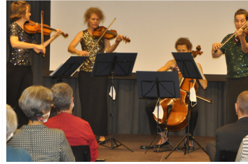
Jubiläumsfeier 100 Jahre FZA