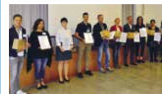
Ehrung der Teilnehmenden KMU

Abschluss Projekt «Vereinbarkeit von Lebenswelten» 10 KMU haben sich erfolgreich am Projekt beteiligt und sich intensiv den Fragen zur Vereinbarkeit gewidmet