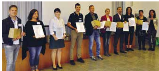
Ehrung der Teilnehmenden KMU

Das Projekt Lebenswelten wurde 2020 erfolgreich abgeschlossen