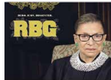
Ruth Bader Ginsburg

Filmmatinee: RGB – Ein Leben für die Gerechtigkeit – Ein Dokumentarfilm über die vortreffliche Ruth Bader Ginsburg, Richterin am Supreme Court der Vereinigten Staaten.