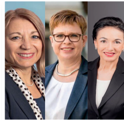
Kandidatinnen 2. Wahlgang Stände- und Regierungsrat